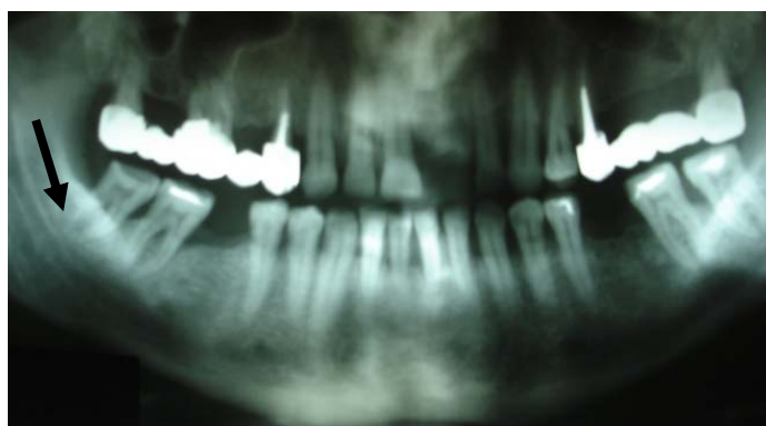
Fig. 1 OPT- punctul de plecare al supurației

Examenul clinic la internare evidențiază exooral prezența unei tumefacții masive, submento-submandibulară bilateral, cu edem cervical extins până la zona supraclaviculară dreaptă și suprasternal. Tegumentele prezintă o congestie moderată iar palpator se poate decela prezența infiltratului inflamator difuz, de consistență crescută și dureros la palpare. Examenul endooral este dificil de realizat datorită trismusului accentuat și evidențiază tumefacția și congestia mucoasei planșeului oral. Endooral sunt evidențiate secreții salivare abundente și prezența unei candidoze la nivelul feței dorsale a limbii.