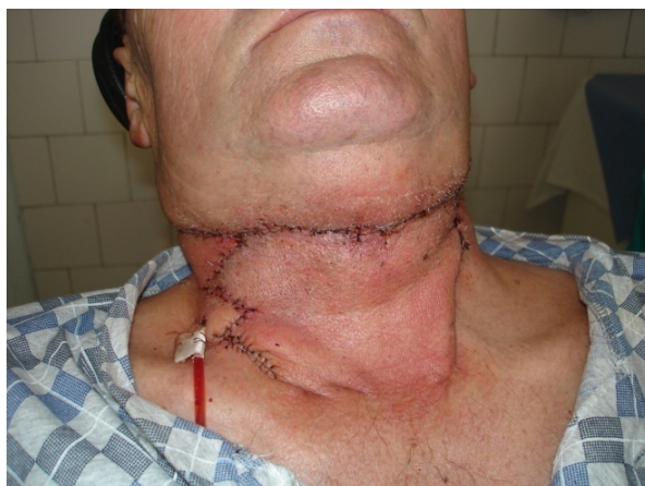
Fig. 6 Aspect clinic postoperator după plastia cicatricilor submandibulare și laterocervicale.