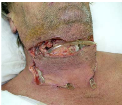
Fig. 2 Aspectul clinic postoperator - după deschiderea spațiilor laterocervicale

Se modifică schema de administrare a antibioticelor și se institue tratamentul cu: Tienam, Amikacină și Metronidazol.