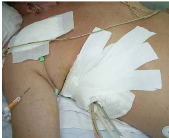
Fig. 4 Drenaj toracic